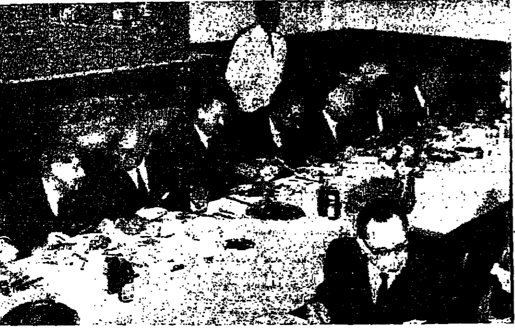
جانب من مائدة الغذاء التي أقامها السيد هشام الجويدي وزير الماكين والسيارات للجنة الوزارية العليا للشؤون الاقتصادية تقريبا للوفد البرلماني الاتحادي للتصوير سيميراميس